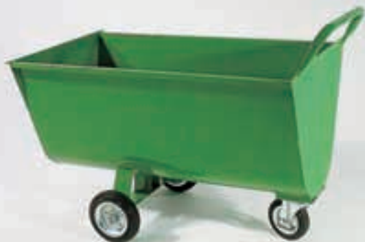
Futterwagen Typ „V“

Bereifung: Vollgummi - Lenkrolle 160/40 mm, Räder 200/50 mm