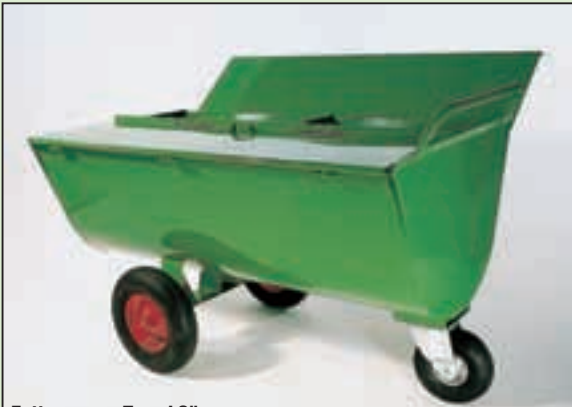
Futterwagen Typ „LS“

TW = Trennwand D = Deckel MB = Mineralbehälter