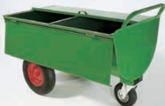
Futterwagen Typ „LL“

Bereifung: Luft - Lenkrolle 230/65 mm, Räder 400/100 mm