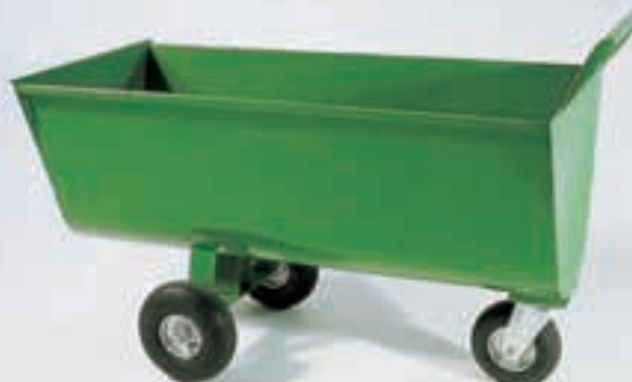
Futterwagen Typ „L“

Bereifung: Luft - Lenkrolle 230/65 mm, Räder 260/85 mm